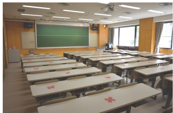
T1号館 T1-11 講義室